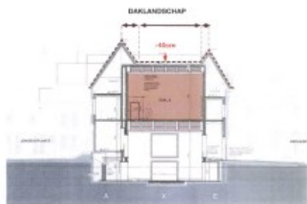
Afb 2: Inbedding grote zaal in aanvraag Afb 3: Inbedding grote zaal na wijziging